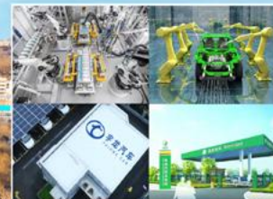
新能源产业链企业