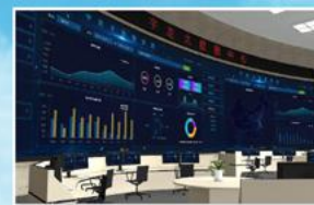
宇龙新能源大数据管理中心