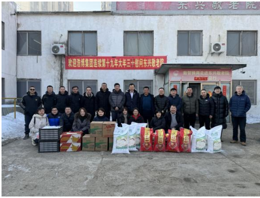
连续 19 年大年三十慰问敬老院